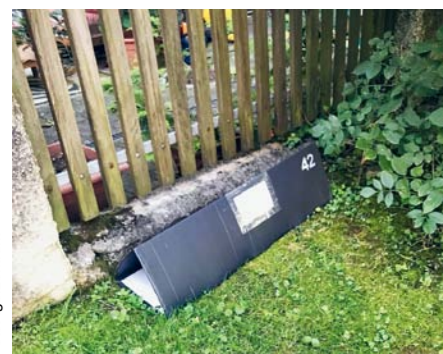
Hier habe ich den Spurentunnel entlang einer Mauer platziert.

Über das gesamte Stadtgebiet war ein Raster von Quadratkilometern ge-